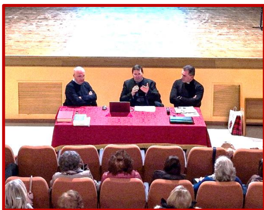
I tre relatori dell'incontro

L'istituzione di una specifica Associazione dovrà curare, unitamente al Postulatore ed alle autorità diocesane, la raccolta degli scritti e delle testimonianze utili a riconoscere la fama di santità, requisito indispensabile per l'avvio della causa. La vostra testimonianza sarà di aiuto e sostegno a questo cammino intrapreso.