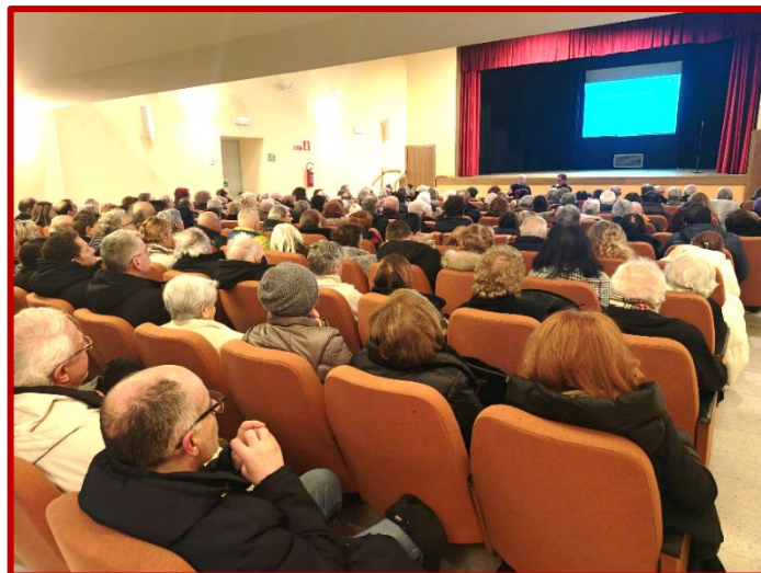
Pubblico presente 25 gennaio 2026 presentazione del percorso per l'avvio della causa di beatificazione