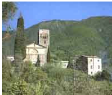
Abbazia di S. Andrea di Borzone (GE)